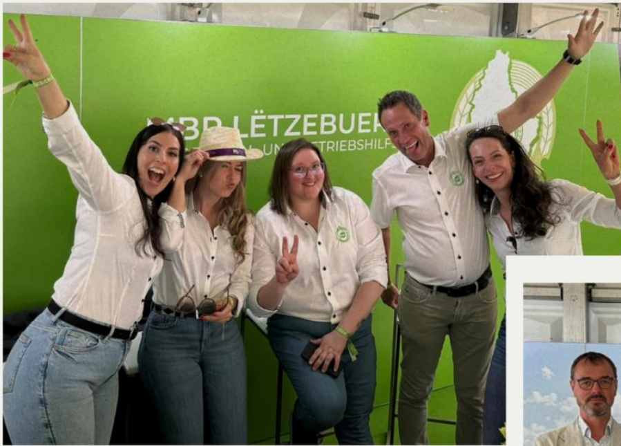
Foire Agricole Ettelbruck